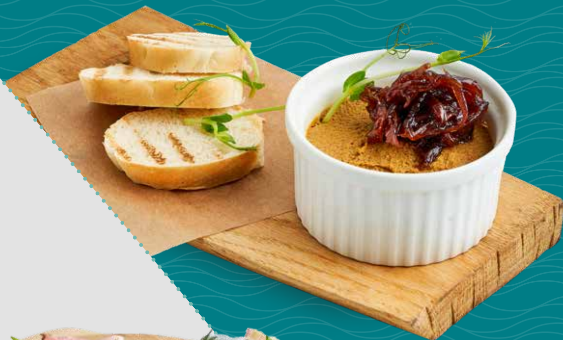
Паштет из куриной печени с луковым конфитюром

печень куриная, лук репчатый, мед, вино красное, гренки из французской булочки