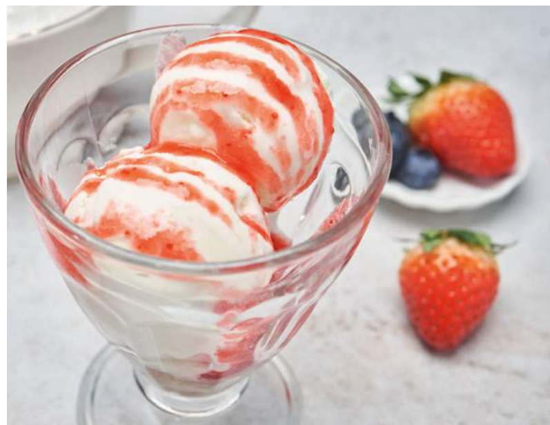
Мороженое с топингом