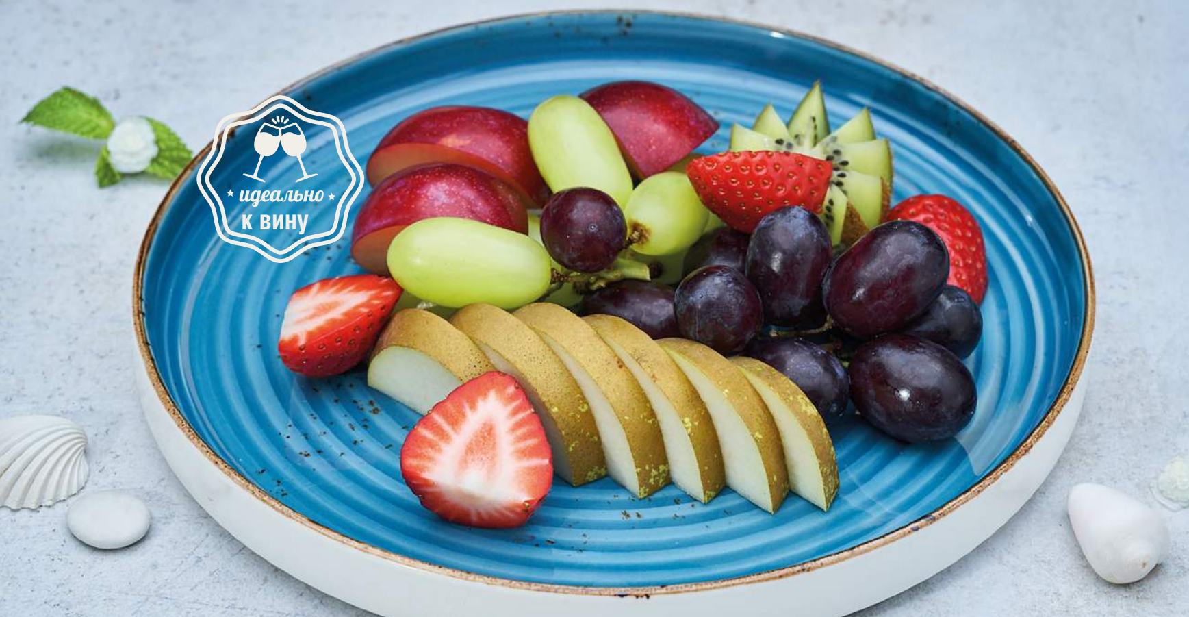
Фруктовая тарелка по сезону