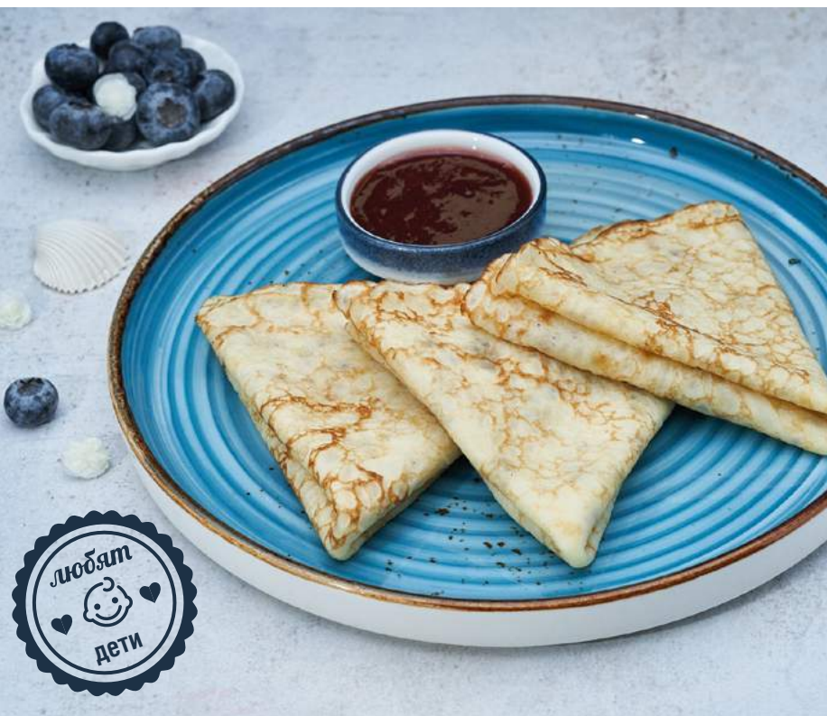
Блины с вареньем