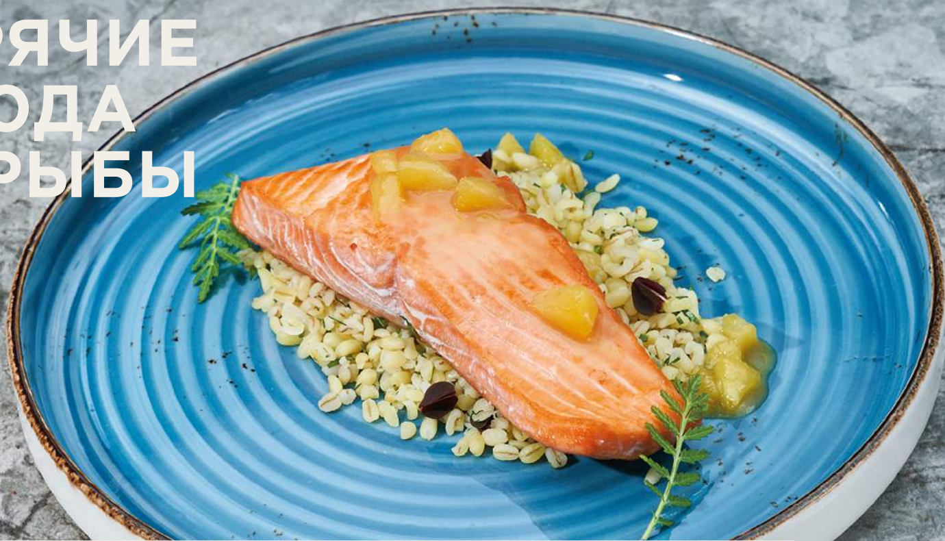
Филе форели с булгуром и цитрусами