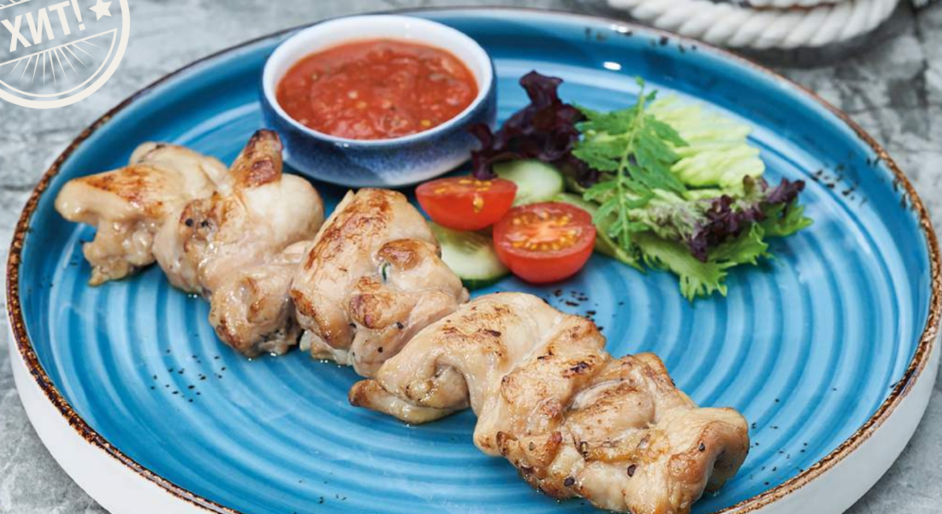
Куриный шашлык со свежими овощами и соусом сацебели