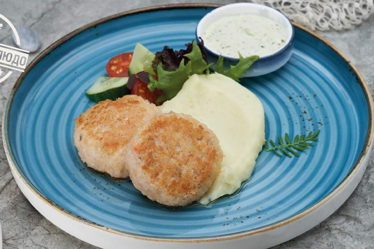
Тельное из рыбы с картофельным пюре и соусом тартар