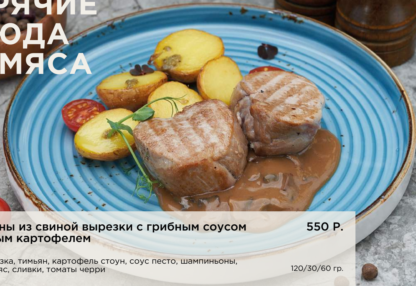
Медальоны из свиной вырезки с грибным соусом и молодым картофелем